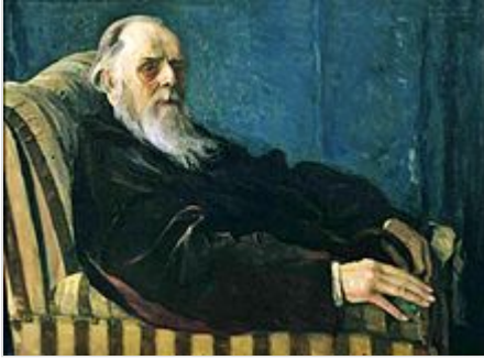
На портрете М. Нестерова незадолго до смерти

высылая доходы хозяевам за границу. На средства матери Владимир Чертков оборудовал типографию в окрестностях Лондона. Там же сформировалось известное издательство «Свободное слово», выпускавшее брошюры о положении верующих в России.