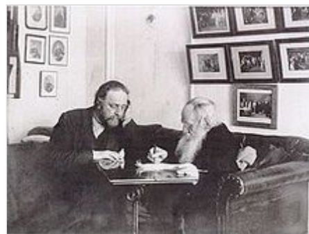
В. Г. Чертков и Л. Н. Толстой. Ясная Поляна . 29 марта 1909 г.

Не без влияния матери и её друзей у Владимира Черткова рано пробудилась тяга к духовным исканиям. Его можно отнести, по определению классиков, к «кающимся дворянам» — новому типу аристократов, заявившему о себе во второй половине XIX в. В жизни Владимира случился момент, когда он встал на путь покаяния. «Будучи двадцатидвухлетним гвардейским офицером, я прожигал свою жизнь, предавшись всем классическим порокам, — вспоминал Чертков. — Я жил как в чаду, с редкими промежутками отрезвления. Бог! Если Ты существуешь, то помоги мне — я погибаю. Так от всего сердца взмолился я однажды и раскрыл Евангелие на том месте, где Христос называет Себя Путём, Истиной и Жизнью. Я получил облегчение, и радость моя в эти минуты была невыразима».