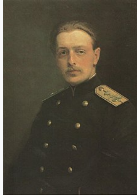
Портрет В. Г. Черткова кисти И. Н. Крамского (1881)