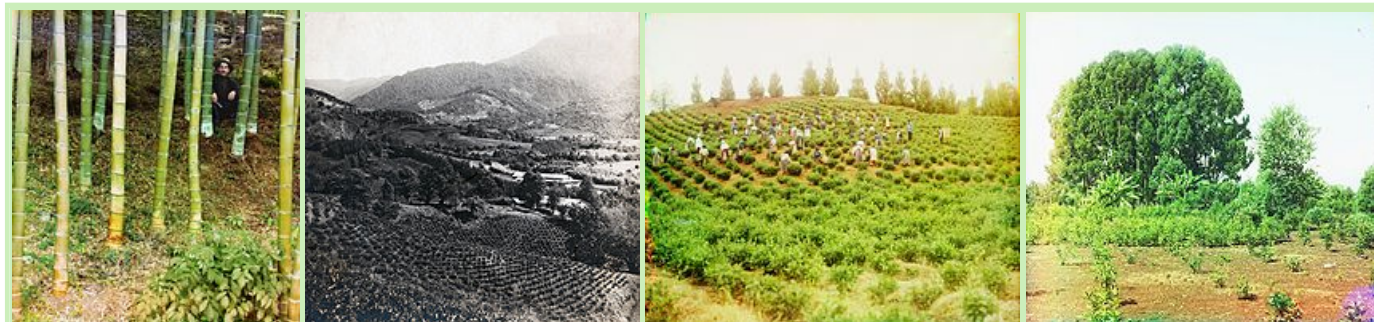
Слева направо: Рабочий сада в бамбуковой роще; Чайная плантация в Чакве; Сбор чая в Чакве; Уголок сада с эвкалиптами и османтусом душистым ( Osmanthus fragrans LOUR.).

Можно <...> сказать, что он [Краснов] во всей своей жизни, как редко кто, остался верен своему молодому плану и провёл его до конца без больших изменений [6] .