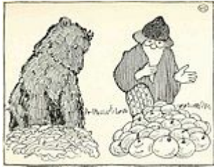
«Мужик и медведь»