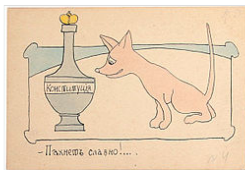
Открытка 1900 года с карикатурой Валерия Каррика [3] .