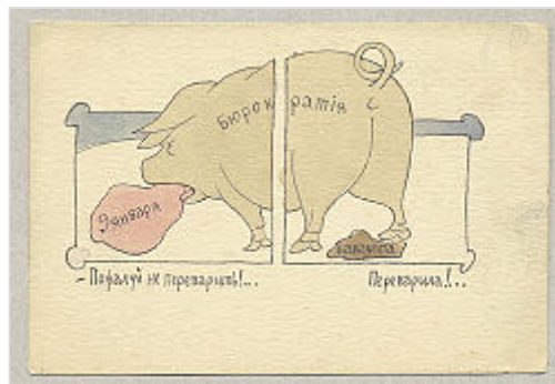
Открытка начала XX века с карикатурой В. Каррика на бюрократию .