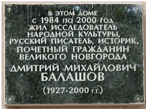
Мемориальная табличка на доме по улице Славной в Великом Новгороде

эпопею Балашов писал, опираясь на работы Л. Н. Гумилёва , вследствие чего, его проза получила более масштабное видение исторического развития Евразии в XIII—XV вв. по сравнению с произведениями новгородского цикла.