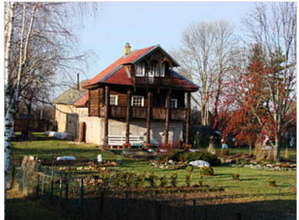
Дом писателя в Козыневе