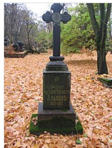
Надгробие М. Н. Альбова на Литераторских мостках

Произведения Альбова делятся на две группы: одна часть рассказов видимо навеяна Достоевским . В них разбираются темы психологические , а часто и психиатрические (« День итога », « Как горели дрова » и т. д.). Эти рассказы отличаются мрачным характером. В них сказывается влияние одинокой и грустной молодости автора . Почти все они относятся к раннему периоду творчества и потому носят более субъективный, рефлексивный характер, чем последующие. Лучший рассказ этого направления — наиболее законченный, отделанный и типичный — « День итога » (напечатанный в « Слове » в 1879 году). Герой его Глазков не лишён болезненной оригинальности. Сам автор прекрасно охарактеризовал его словами: «Ты — сочетание стремлений орла и сил Божьей коровки: так это есть, и переменить этого ты не можешь». В силу этого является раздвоенность личности , вечный самоанализ , парализующий всякое искреннее движение души , болезненно развито самолюбие и рисовка во всём. В Глазкове два человека: один живёт в действительности , другой с насмешкой контролирует его поступки. Отсюда вытекает неестественность, желание так или иначе обратить на себя внимание, Глазков даже лишить себя жизни не может просто: всё делается с разными вычурами: перед смертью он произносит речь , где говорит о высшем блаженстве поклониться самому себе. Он напоминает « Двойника » Достоевского и героя « Записок из подполья » своим возмутительным поведением с несчастными забитыми существами, искренно ему преданными .